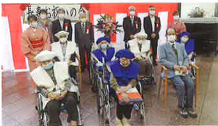
皆さんで記念撮影