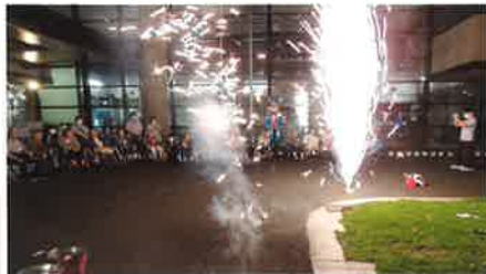
舞い上がる吹上花火