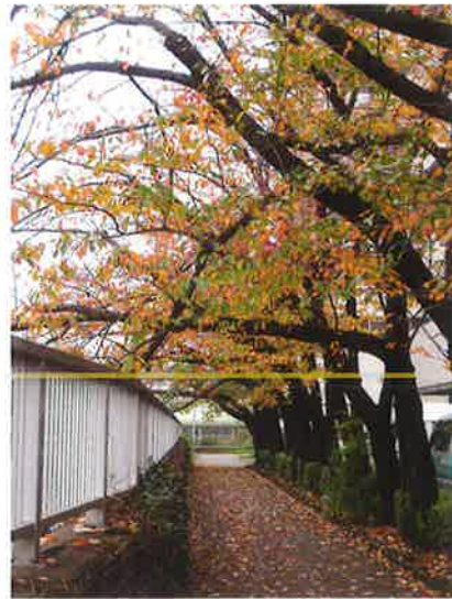
目黒川沿いさくら並木の紅葉