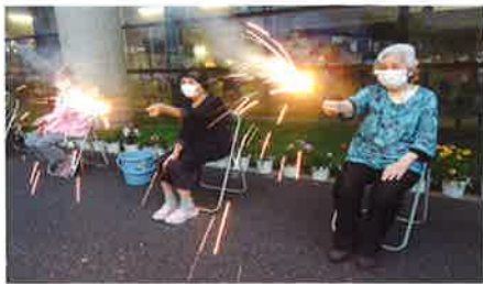
「手持ち花火の饗宴」