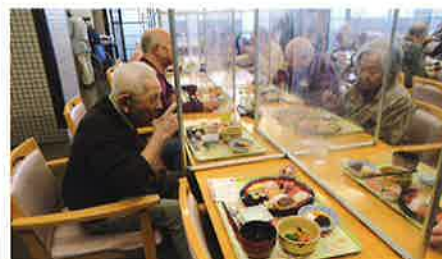
「お寿司、大好きです」