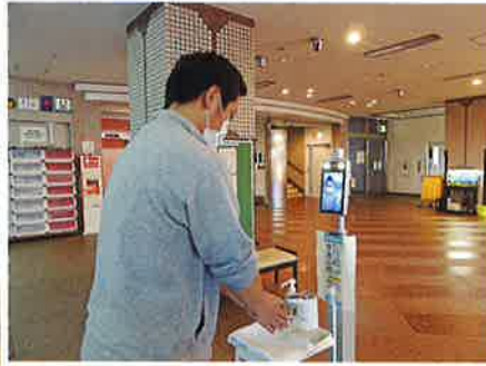
▶ 非接触型体温計を設置 (本部建物)